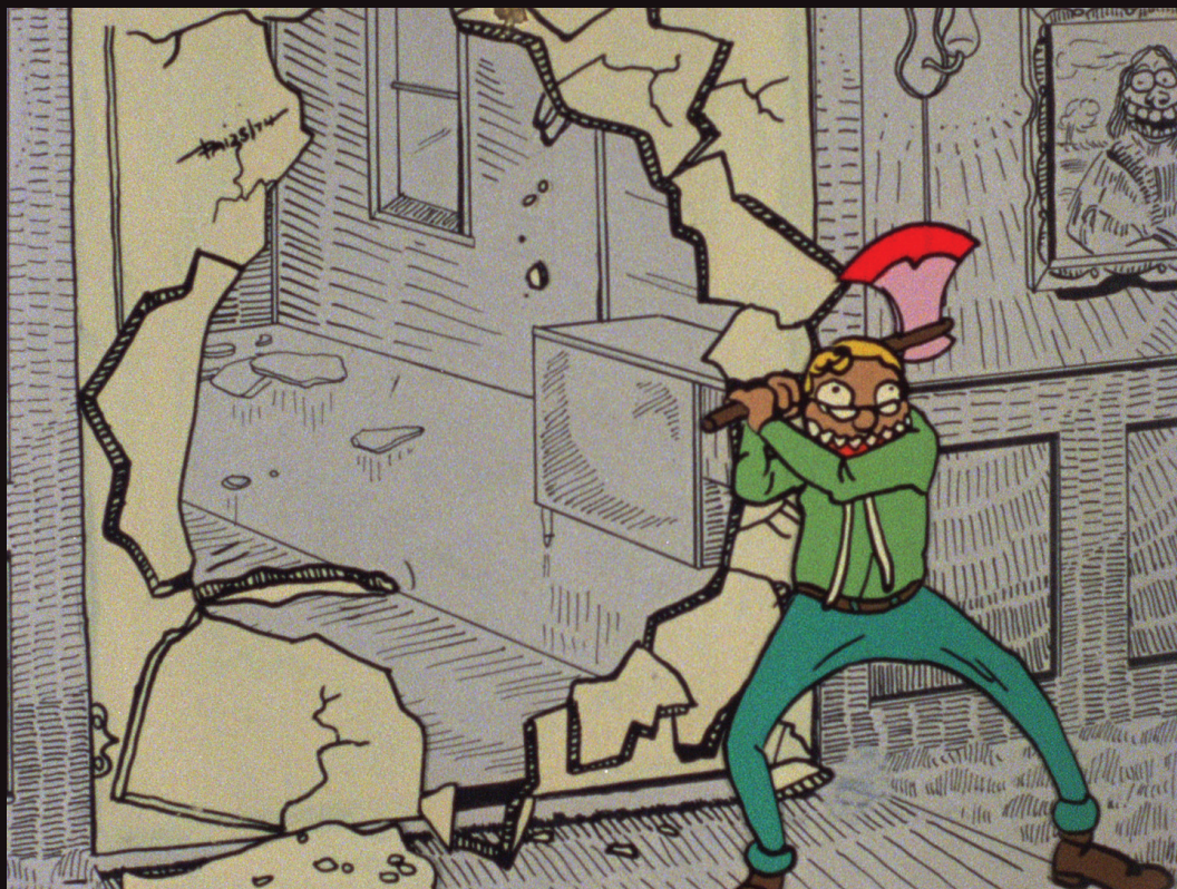
The Nine to Five Crack

À l'opposé de la mentalité alternative que s'imposent les pseudo-télépathes de Lowe, je le veux ( i want it ) de Murray Toews nous transporte dans une réalité parallèle où la commodité et la consommation sont primordiales et où la Terre est condamnée